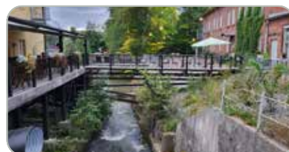
Fiskars oli mielenkiintoinen tutustumiskohde.