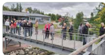
Nordcenterin pelimatalla opaskierros Fiskarsissa.