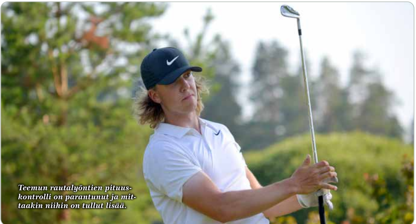
Teemun rautalyöntien pituuskontrolli on parantunut ja mitaakin niihin on tullut lisää.

– Tykkään pelata johtoasemassa. Olen varma pelaaja, eikä paineiden kanssa ole ollut ongelmia. Varmaan se johtuu maalivahtitaustasta.