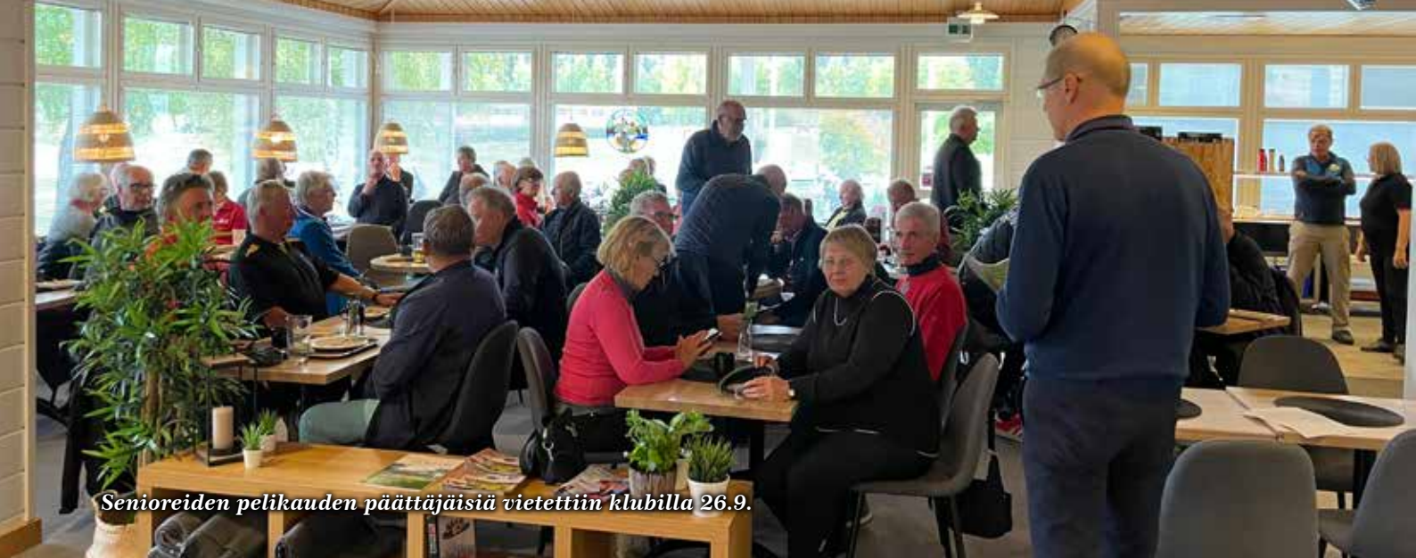
Senioreiden pelikauden päättäjäisiä vietettiin klubilla 26.9.