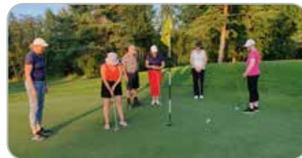
Toimintarajoitteiset kentällä, puttaamista viheriöllä neljä.