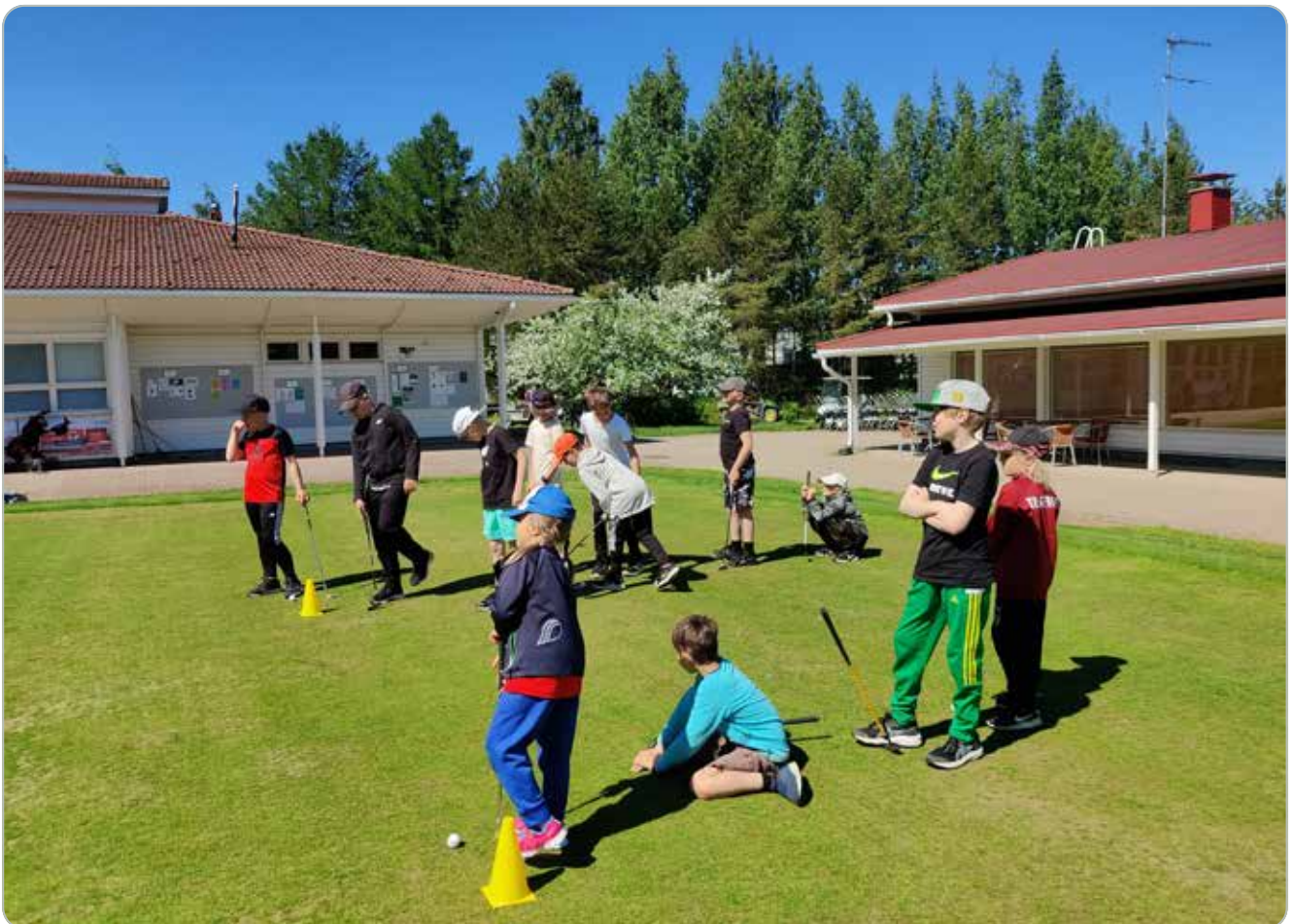
Junioreiden päiväleirit alkoivat kesäkuussa.