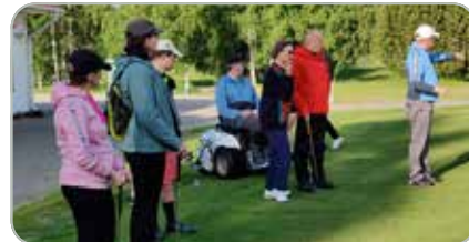
Pro Esa Lehti vastasi HCP-golfin opetuksesta.