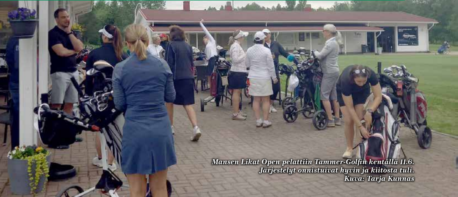
Mansen Likat Open pelattiin Tammer-Golfin kentällä 11.6. Järjestelyt onnistuivat hyvin ja kiitosta tuli.